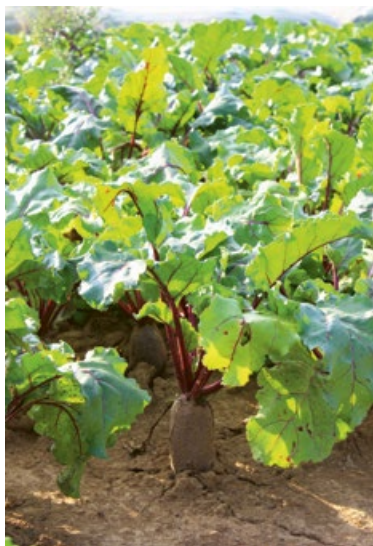
La remolacha es una planta herbácea biennial. Durante el primer año se desarrollan el tubérculo y una roseta de hojas.

En el proyecto hemos trabajado con diferentes variedades y nuevos cultivos de remolacha de huerto y hemos analizado sus propiedades agronómicas, como el rendimiento, la forma, el aspecto, el color y la susceptibilidad a enfermedades, así como diversos componentes, como el contenido total de azúcares, colorantes, nitratos y fenoles.